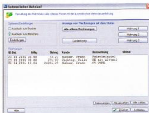
Verwaltung des Mahnstatus aller offenen Posten mit der automatischen Mahnstatuserhöhung.

Was die Betreuung betrifft, so ist die Hotline